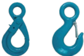
GANCHOS CON OJO GRADO 80