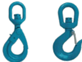
GANCHOS GIRATORIOS GRADO 80