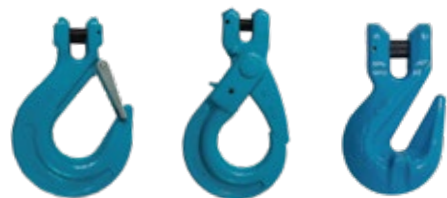
GANCHOS CON CLEVIS GRADO 80