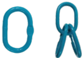
ARGOLLAS GRADO 80